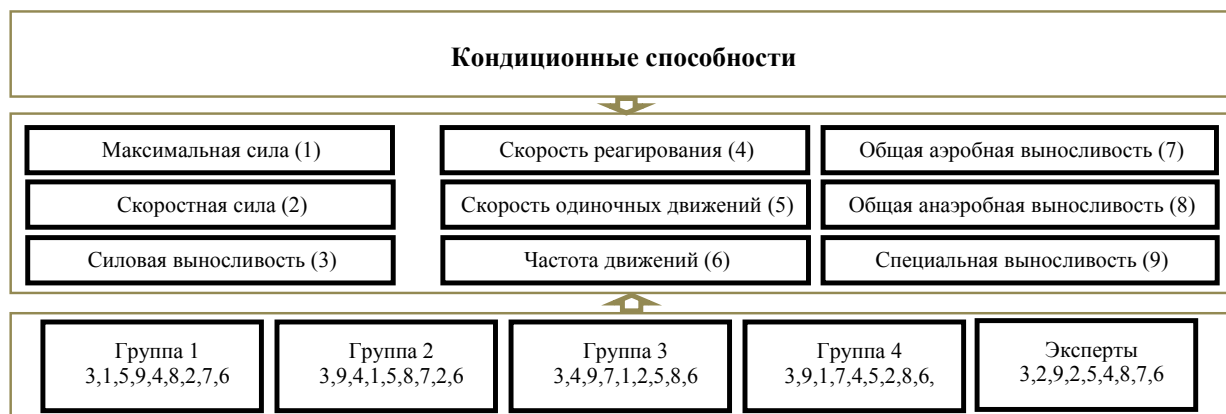
Рисунок 1 – Изменения иерархической структуры кондиционных двигательных способностей в длительном процессе профессионального совершенствования сотрудников МОБ

В результате проведенных исследований выявлено, что в группе ПВК, характеризующих кондиционную подготовленность сотрудников МОБ (рисунок 1), приоритетными являются способности, характеризующие силовую и специальную выносливость. Для начинающих сотрудников высокую значимость также имеют показатели максимальной силы и скорости одиночных движений. В группах со стажем «5–10 лет» и «11–15 лет» силовую и специальную выносливость дополняет способность к быстрому реагированию. В группе сотрудников со стажем «16 лет и более» значимость способности к быстрому реагированию несколько снижается, что объясняется формированием у них специфических компенсаторных возможностей (способности к прогнозированию и т. п.). Респонденты всех групп отметили относительно низкую значимость для сотрудников двигательных способностей, характеризующих способность к высокому темпу движений, общую анаэробную выносливость и скоростную силу. По мнению экспертов, для сотрудников МОБ приоритетными являются двигательные способности, характеризующие силовую выносливость, скоростную силу и специальную выносливость.