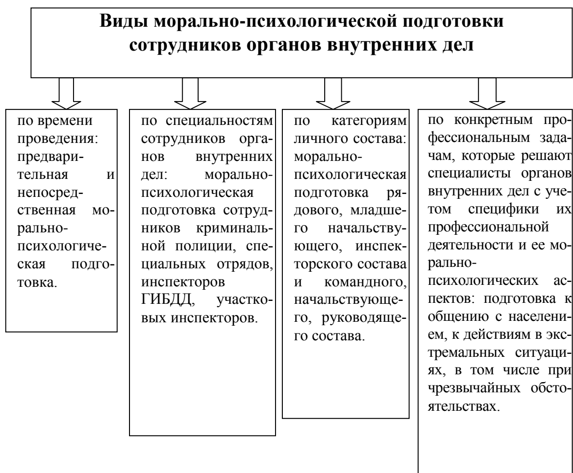
Рисунок 2 – Виды морально-психологической подготовки сотрудников органов внутренних дел

осуществляется посредством морально-психологической подготовки как составляющей профессиональной подготовки специалистов – сотрудников органов внутренних дел в период их обучения в ведомственной образовательной организации. При этом морально-психологическая подготовка охватывает и обучение, и воспитание, и личностное развитие обучающихся. Исходя из единства целей, задач и содержания морально-психологической подготовки, можно утверждать, что это - комплексный вид подготовки, сочетающийся со специфическим практико-ориентированным обучением курсантов как будущих специалистов – сотрудников органов внутренних дел. Имея общую основу для всего личного состава органов внутренних дел, морально-психологическая подготовка ориентируется и дифференцируется применительно к решению частных задач образования сотрудников, определяя различные виды такой подготовки. Виды морально-психологической подготовки мы представили на рисунке 2.