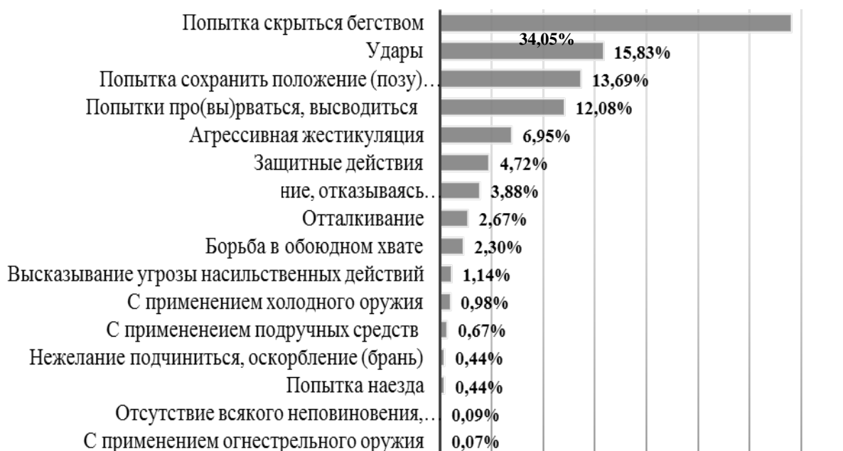
Рисунок 2 – Распределение частот (в %) характера сопротивления (С. Mesloh, M. Henych, R. Wolf, 2008)

В исследовании С. Mesloh, M. Henych, R. Wolf (2008) [9] было показано, что первоначальным физическим воздействием со стороны сотрудников полиции сопротивление пресекается чуть более в половине случаев – 55,6 %. В следующей (второй) фазе сопротивление прекратилось еще в 29,3 % случаев, то есть после повторного применения силы сопротивление было пресечено в 84,9 % случаев. В третьей фазе – еще в 15 % случаев. Таким образом, в 99,9 %