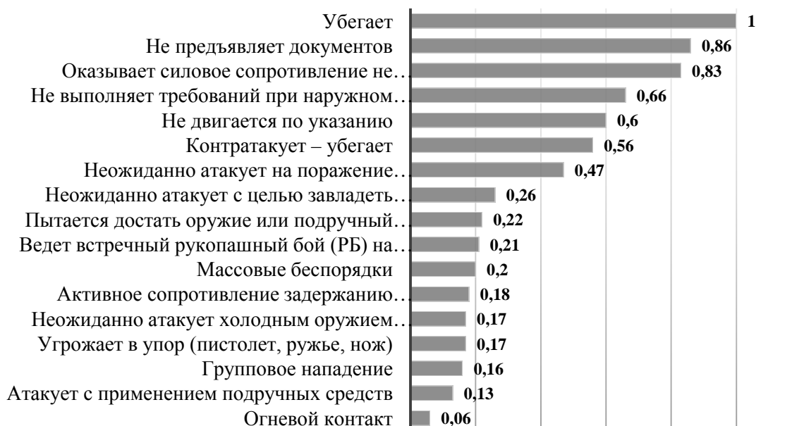
Рисунок 1 – Относительные приоритеты частот характера сопротивления (В.П. Вдовиченко, С.В. Кузнецов, 2000) [4]